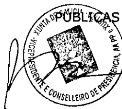
Alfonso Rueda Valenzuela

POR LA VICEPRESIDENCIA Y CONSELLERÍA DE PRESIDENCIA, ADMS. PÚBLICAS Y JUSTICIA