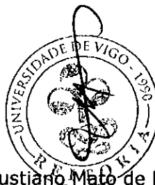
Salustiano Mato de la Iglesia